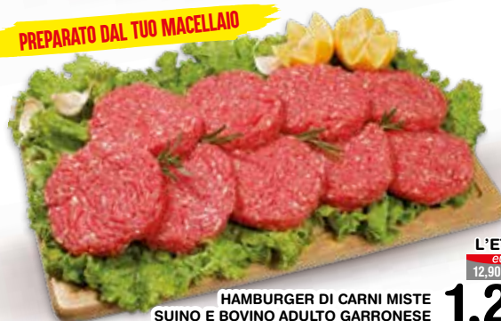
HAMBURGER DI CARNI MISTE SUINO E BOVINO ADULTO GARRONESE