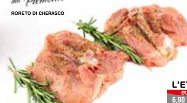
RUSTICHELLI DI POLLO NOSTRANO PER GRIGLIA

Sole PERGATE del Piemonte RORETO DI CHERASCO