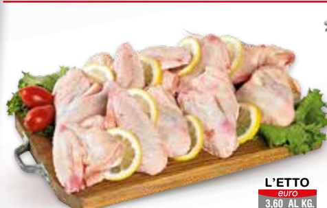
ALETTE DI POLLO NOSTRANO PER GRIGLIA