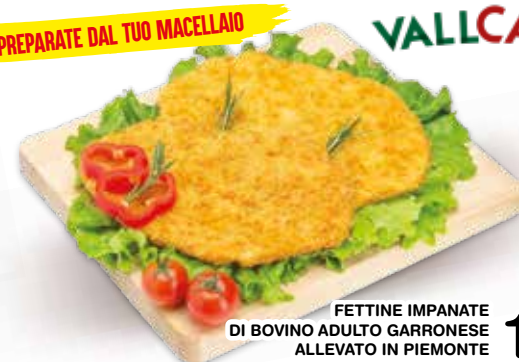
FETTINE IMPANATE DI BOVINO ADULTO GARRONESE ALLEVATO IN PIEMONTE