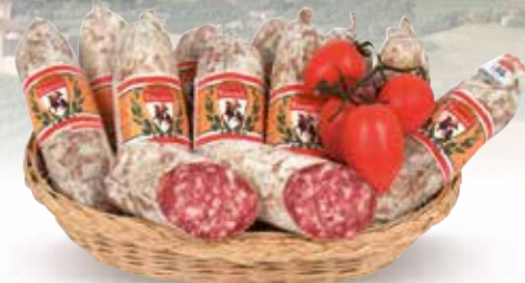
SALAME CRUDO CACCIATORINO MONCALVINO SPECIALITÀ