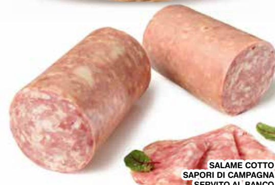
SALAME COTTO SAPORI DI CAMPAGNA SERVITO AL BANCO