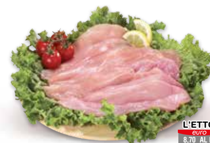
PETTO DI POLLO NOSTRANO A FETTE

ESCLUSIVAMENTE POLLO NATO, ALLEVATO E MACELLATO IN PIEMONTE, NEL RISPETTO DEL TERRITORIO.