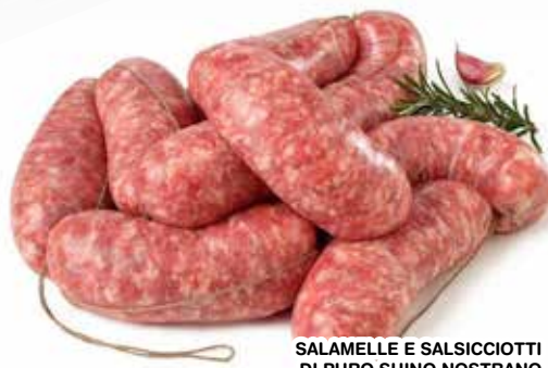
SALAMELLE E SALSICCIOTTI DI PURO SUINO NOSTRANO