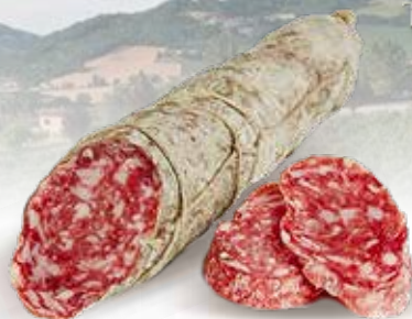
SALAME CRUDO PAESANO INTERO E A METÀ SERVITO AL BANCO