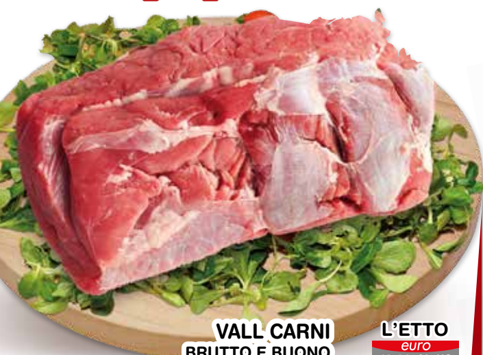
VALL CARNI BRUTTO E BUONO DI BOVINO AULTO GARRONESE ALLEVATO IN PIEMONTE OTTIMO PER ARROSTI