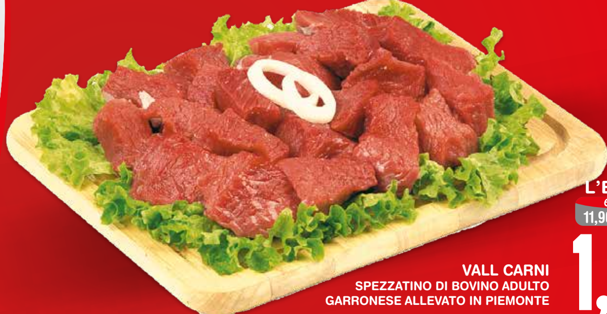
VALL CARNI SPEZZATINO DI BOVINO ADULTO GARRONESE ALLEVATO IN PIEMONTE

QUALITÀ, TRADIZIONE, GENUINITÀ SONO I VALORI CHE LA NOSTRA TERRA CI HA INSEGNATO.